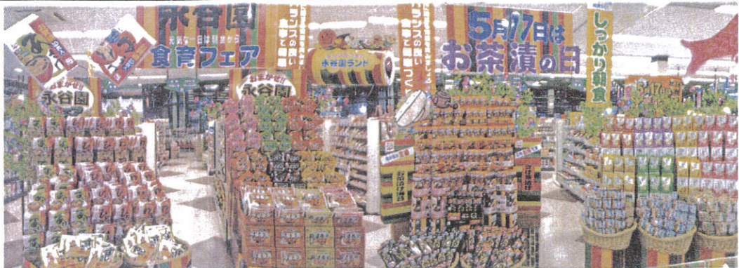
永谷園「大陳写真コンテスト」